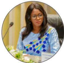
Discours de Madame la Directrice Générale du COSEC