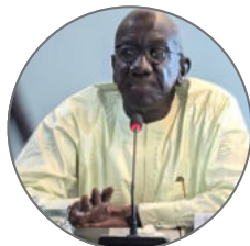
Mot du Président du Conseil d'Administration du COSEC