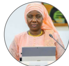
Discours de Madame le Ministre des Pêches, des infrastructures Maritimes et Portuaires