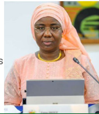
Madame Fatou DIOUF Ministre des Pêches, des Infrastructures Maritimes et Portuaires